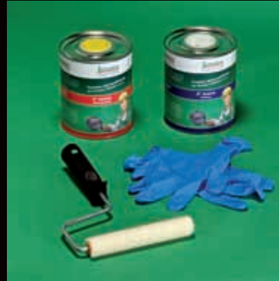
Contenuto della confezione "small" (1 Lt. + 1 Lt.) con resa fino a 15 mq.

Elimina problemi di infiltrazioni da microfessurazioni