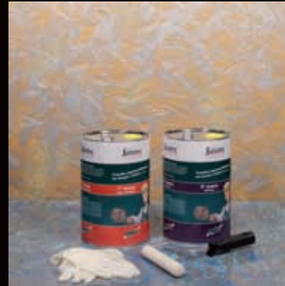
Contenuto della confezione "large" (5 Lt. + 5 Lt.) con resa fino a 75 mq.