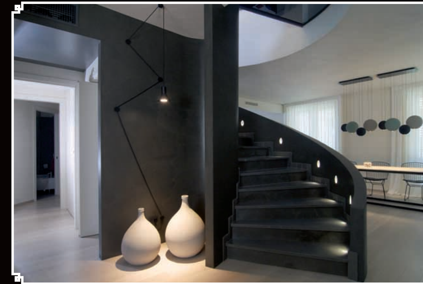
Effetti intensi e cromie accattivanti. Le decorazioni a parete Decorésina conferiscono agli ambienti quel tratto inequivocabile di eleganza e ricercatezza. Punto di arrivo di ogni sofisticata astrazione di design.