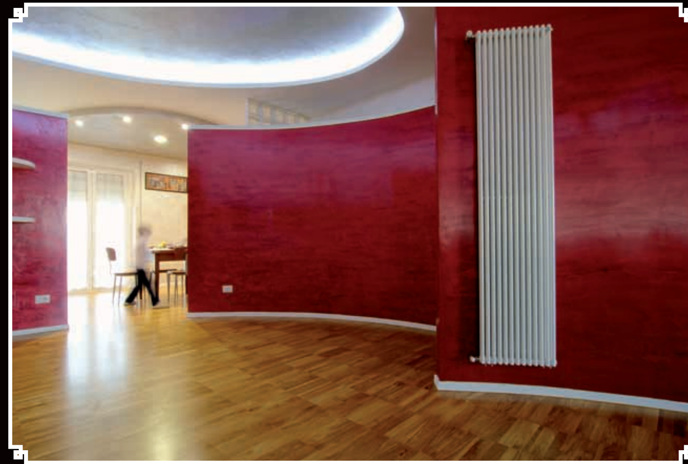
Colori cangianti raffinati e gli effetti spatolati, esaltano la qualità intrinseca delle resine. Un mix straordinario per offrire infinite composizioni. Pregiate decorazioni ideate per ambienti abitativi e concept area quali showroom, sale di esposizione e locali commerciali.